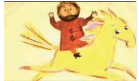
«Король забывает» (реж. В. Федорова, 2006 г.)