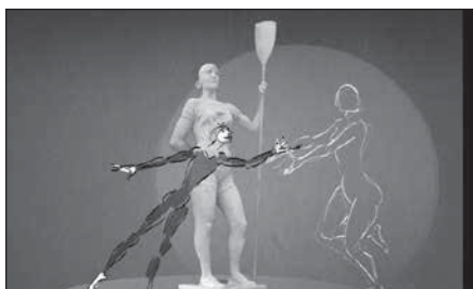
«Вопjour» (реж. А. Абашина, 2010 г.)