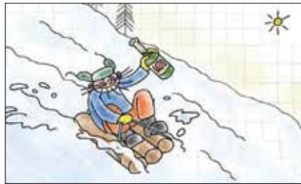
«Наше все!» (реж. Е. Воронцова, 2012 г.)