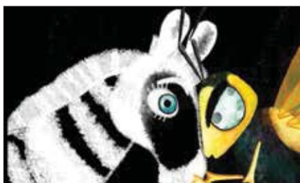
«Полосатая история» (реж. Н. Наумова, 2013 г.)