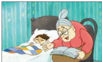
«Песни бегемотов» (реж. А. Галкин, 2013 г.)