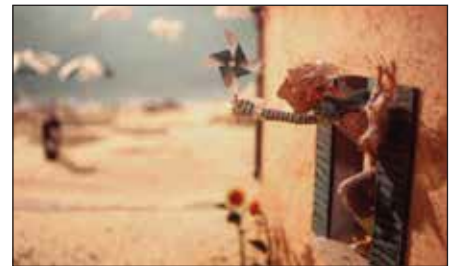
«Мой странный дедушка» (реж. Д. Великовская, 2011 г.)