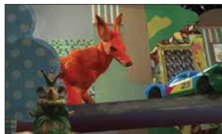
«Мальчик и лис» (реж. С. Тугайбей, 2012 г.)