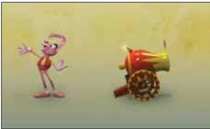
«Сюрприз» (реж. Р. Корнаушкин, 2013 г.)