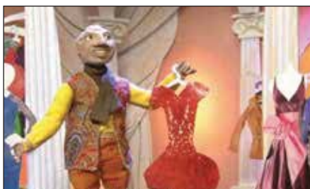
«Кукла» (реж. Е. Шлегель, 2012 г.)