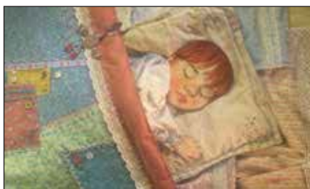
«Сказка» (реж. Н. Грофпель, 2014 г.)