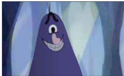
«Мальчик и монстр» (реж. Ю. Журавлёва, 2013 г.)