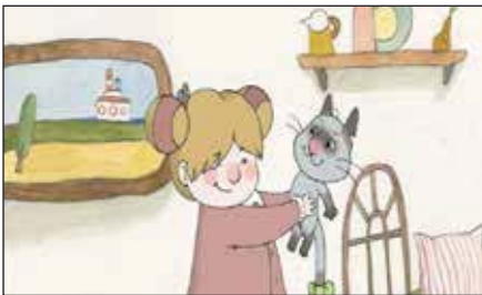
«Игрушка» (реж. А. Терентьева, 2012 г.)